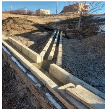
عملیات بازسازی معابر روستای گزور علیا