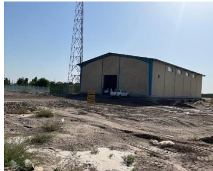
احداث سالن ورزشی روستای تورنج